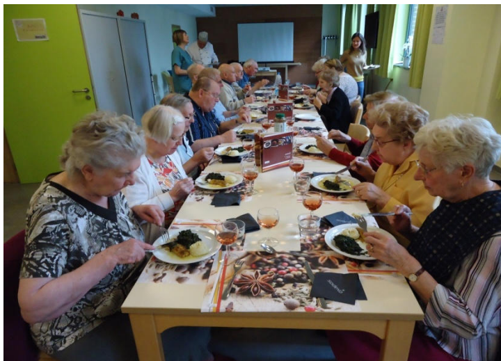
Après l'effort, la récompense. Repas saveur et découverte d'épices.