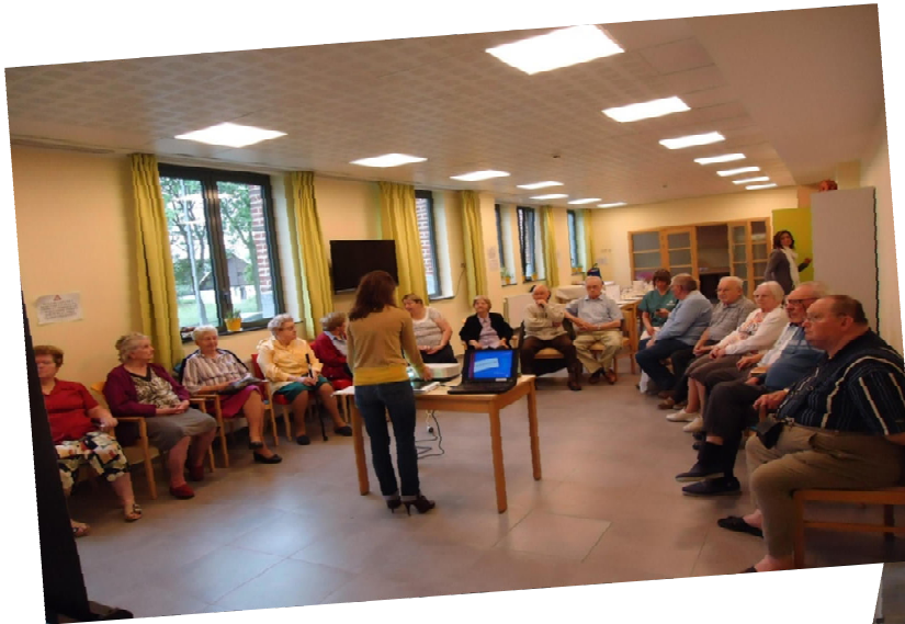
Petite séance d'information sur l'alimentation