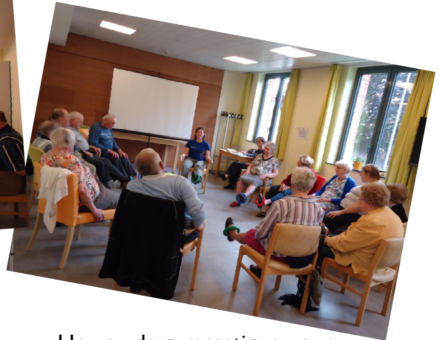
Un peu de gymnastique pour rester en forme